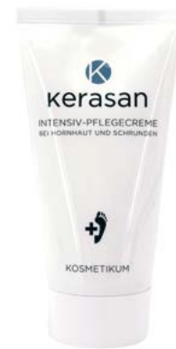
Keratan krém více info na straně 27