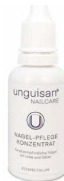
Unguisan Tinktura na nehty více info na straně 22